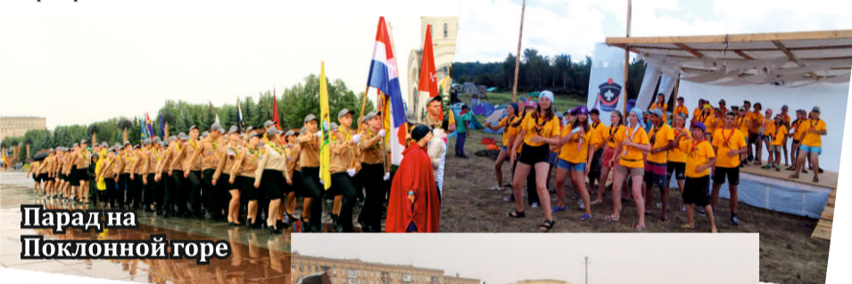
Парад на Поклонной горе

30 июля на слёте был день скаутских соревнований. Делегация Пермского края активно участвовала во всех соревнованиях: отряд «Данко» (Пермь) -