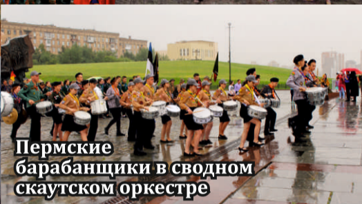
Пермские барабанщики в сводном скаутском оркестре

победители в перетягивании каната, отряд «Ориентир» (с. Усть-Качка) – 1 место по волейболу, отряд «Чайка» (с. Гамово) – 1 место на полосе препятствий, 1 место в соревнованиях по туристическим узлам, 3 место в соревнованиях по лапте.